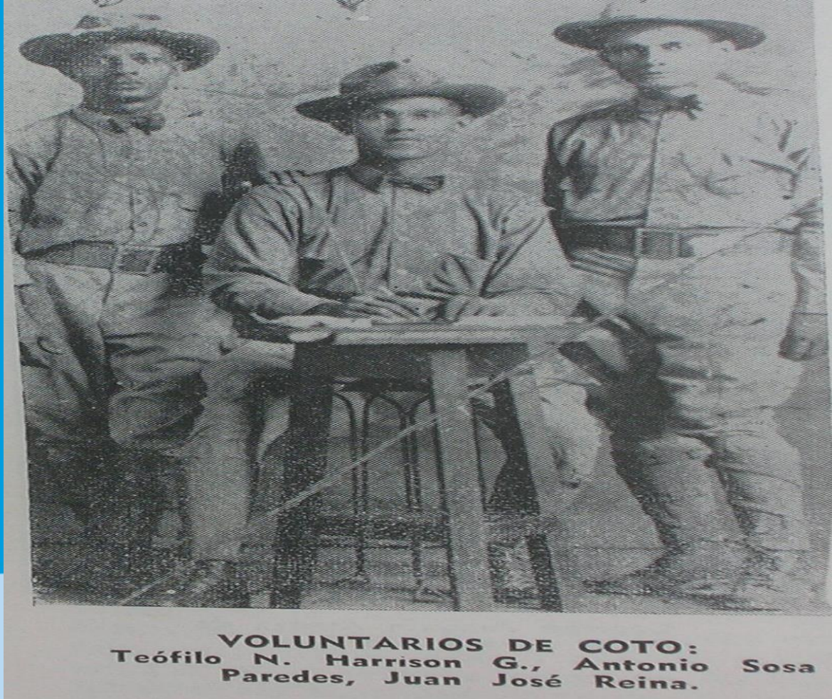
Imagen de algunos voluntario