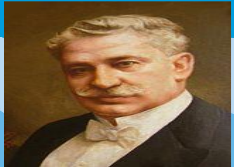
Julio Acosta García, Costa Rica 1920-1924